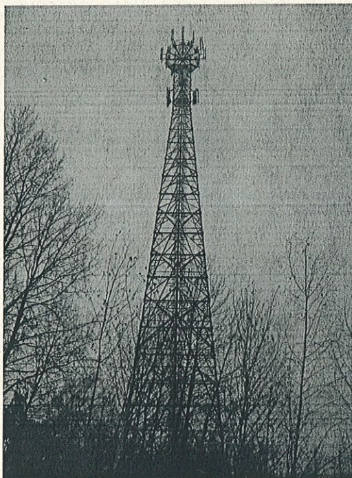
Zał. nr 1: Widok ogólny instalacji radiokomunikacyjnej.

Koniec sprawozdania. Sprawozdanie zawiera dodatkowo załączniki nr 1 i 2.