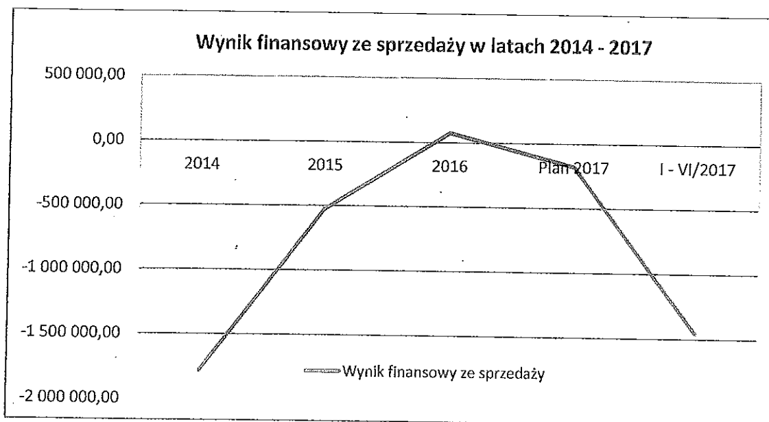
Wykres 2. Wynik finansowy ze sprzedaży w latach 2014 -2017

W latach 2014 – 2016 wynik finansowy ze sprzedaży miał wyraźną tendencję rosnącą i z poziomu -1.783.234,02 zł w 2015 r. osiągnął wartość dodatnią w 2016 r., tj. zysk w wysokości 74.119,43 zł. W roku bieżącym planowany jest wynik ze sprzedaży na poziomie -176.999 zł. Z powodu wykonania niższych od planowanych przychodów i przekroczenia planowanych wartości kosztów wynik finansowy ze sprzedaży na dzień 30.06.2017 r. wyniósł -1.455.593,15 zł. Dynamikę wyniku finansowego ze sprzedaży prezentuje wykres 2.