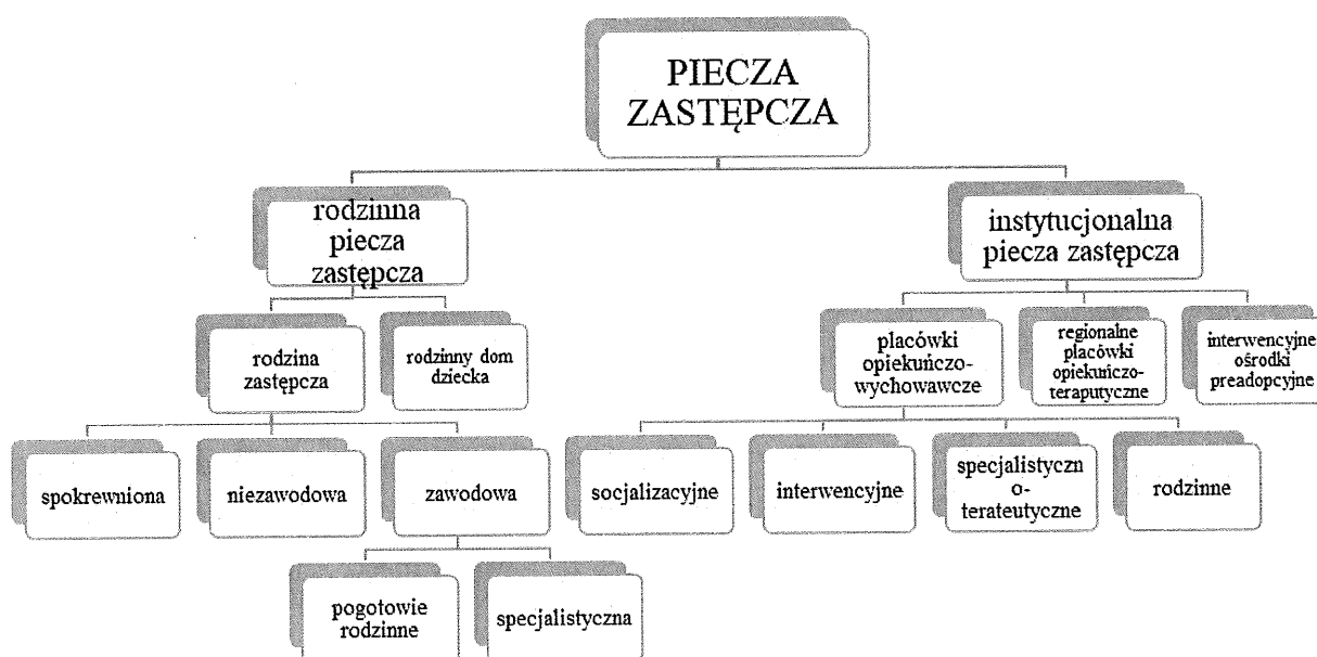
Schemat 1 Struktura pieczy zastępczej w świetle ustawy o wspieraniu rodziny i systemie pieczy zastępczej.

Reasumując powyższe samorząd powiatowy winien tak prowadzić politykę w obszarze pieczy zastępczej, aby przebywające w niej dzieci miały szansę prawidłowego rozwoju i perspektywy na przyszłe życie i tym samym dążenie do rozwoju rodzinnej pieczy zastępczej.