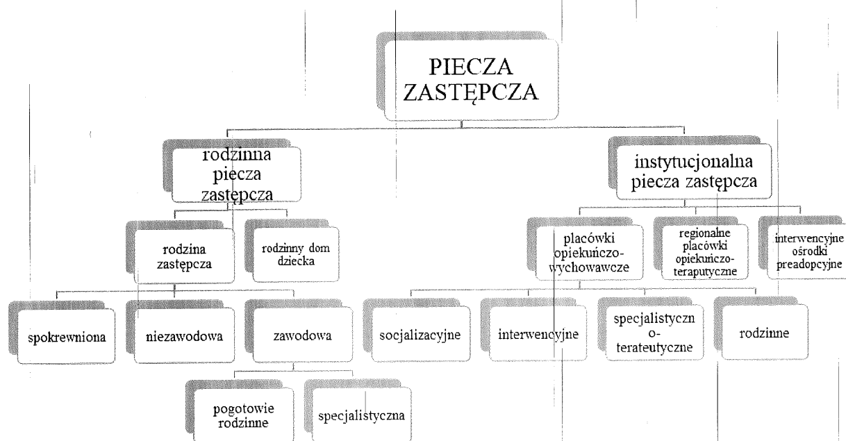
Schemat 1 Struktura pieczy zastępczej w świetle ustawy o wspieraniu rodziny i systemie pieczy zastępczej.

Reasumując powyższe samorząd powiatowy winien tak prowadzić politykę w obszarze pieczy zastępczej, aby przebywające w niej dzieci miały szansę prawidłowego rozwoju i perspektywy na przyszłe życie i tym samym dążenie do rozwoju rodzinnej pieczy zastępczej.