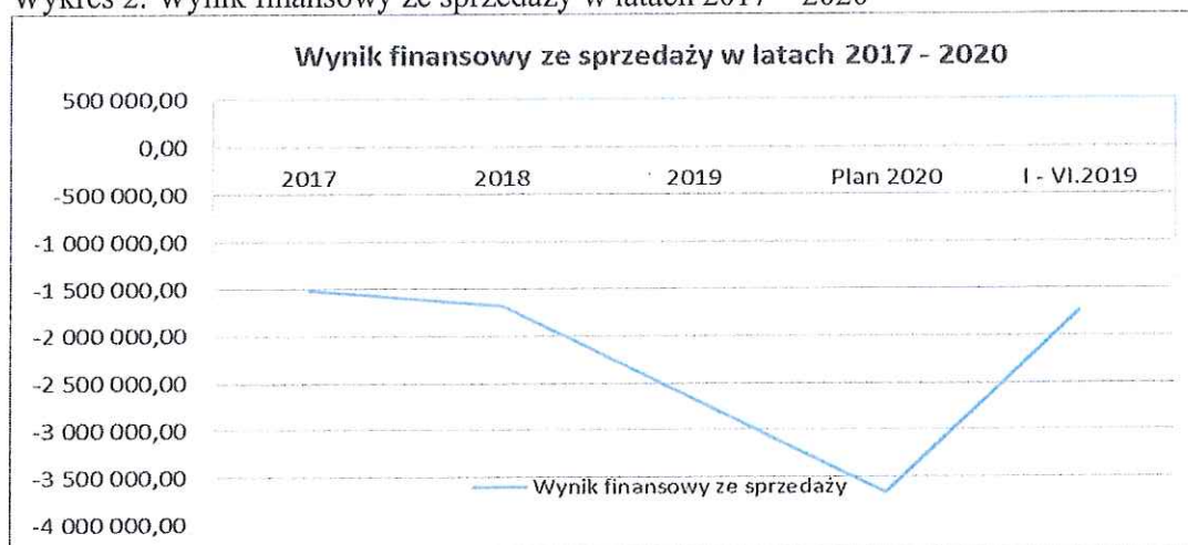
Wykres 2. Wynik finansowy ze sprzedaży w latach 2017 – 2020

W latach 2016 – 2019 wynik finansowy ze sprzedaży ma tendencję malejącą. W roku bieżącym planowany jest wynik ze sprzedaży na poziomie -3.661.855,00 zł. Dynamikę wyniku finansowego ze sprzedaży prezentuje wykres 2.